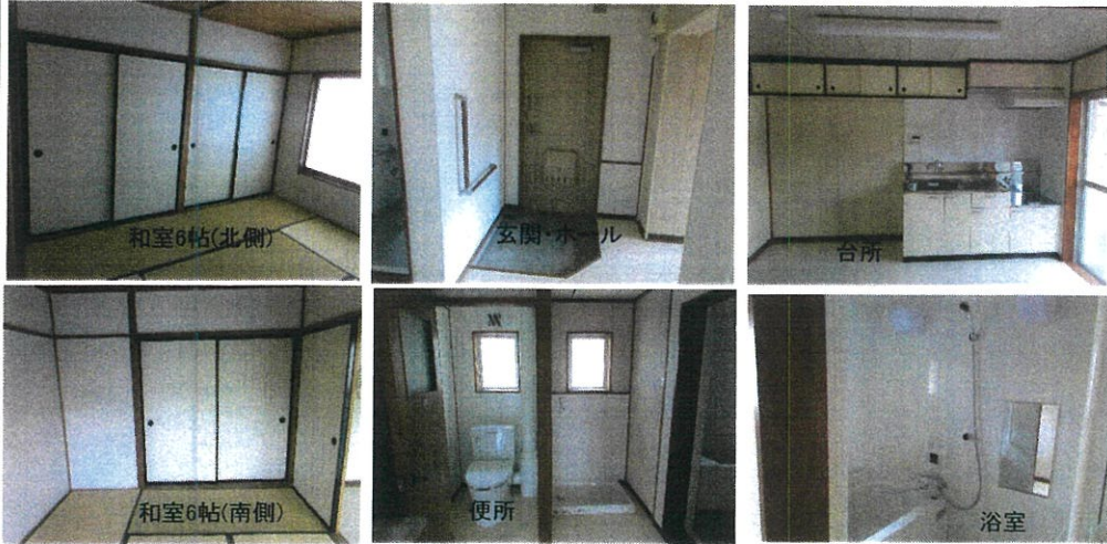
住戸平面図(部屋番号末尾偶数は反転)