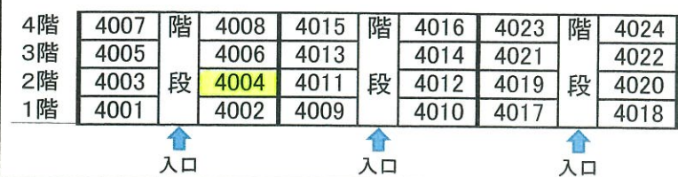
部屋番号図(階段室側から見て)