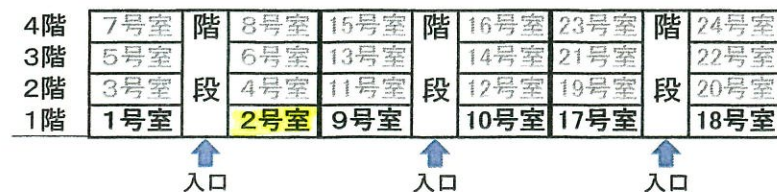
部屋番号図(北側階段室から見て)

近隣状況 ・白河駅 約2.0km ・八竜バス停 約0.45km ・白河第三小学校 約0.96km ・白河中央中学校 約1.5km ・白河厚生病院 約5.0km ・ライフポートわしお 約0.93km (マーケット)