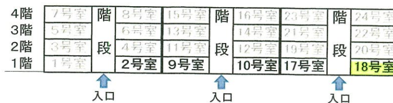
部屋番号図(北側階段室から見て)